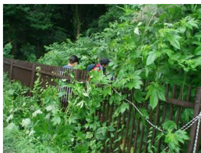
[8/13 オオブタクサに埋もれながら]