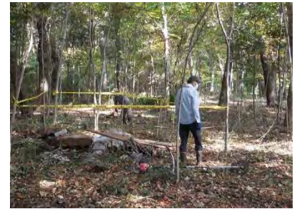
[11/11 林内に散在したごみ集約]

そこで素人まがいの提案です。危険な樹は伐採のみとし、その場に放置し放しか、後日処理する段階的な対応でも良いのではないのでしょうか。是非ご検討をお願いしたいと考えます。因みに 12 月 13 日は令和 4 年最後の作業日となりますので宜しくお願いします。』