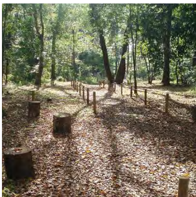
[11/10 木洩れ陽が心地よい]