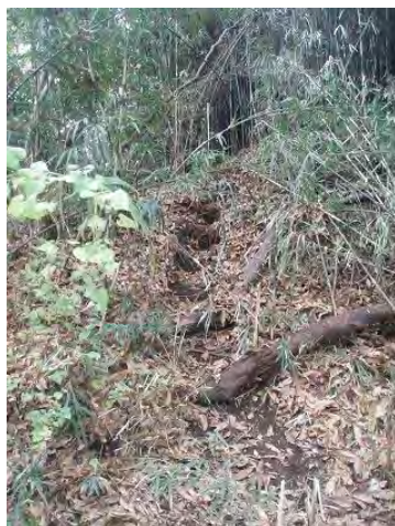
[11/29 斜面に刻まれたステップ]