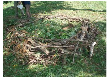
[8/4 完成したバイオネスト]