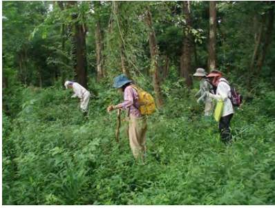
[7/11 サッカー場西側作業]