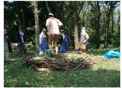
[8/4 バイオネストでトランポリン]