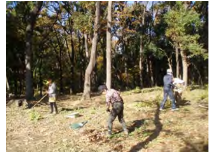
[11/30 バイオネスト造り-1]