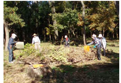
[11/30 バイオネスト造り-2]