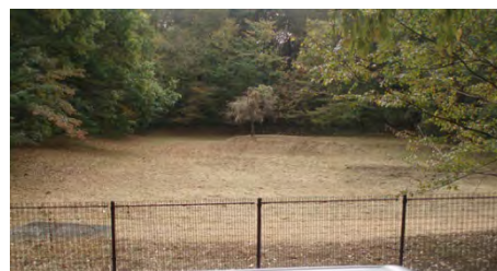
[11/26 刈り込みされた湿地]

来年 4 月になれば緑の葉を付けて、桜の花が咲いている景色をおもいめぐらして、湿地を後にしました。』