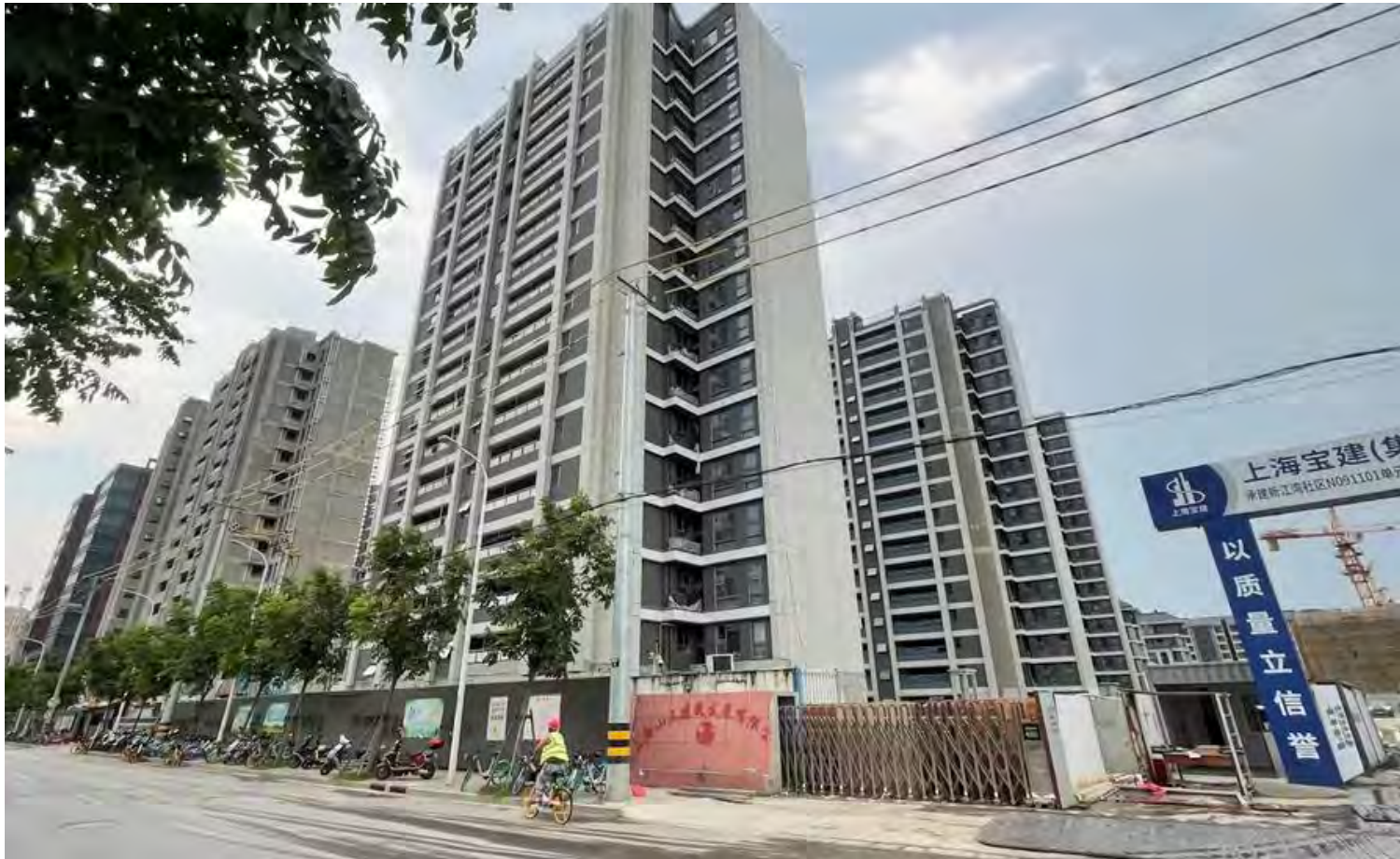
不動産不況が中国経済の重荷 (2023年8月、上海、経営難に陥った碧桂園の建設現場)