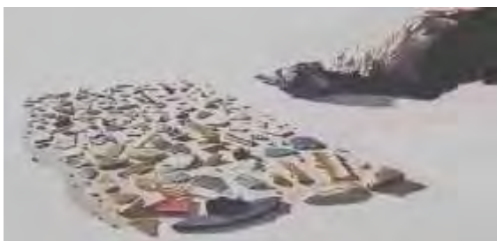
ひな鳥のお腹の中から出たプラスチック 映画「プラスチックの海」より

○海鳥の雛。胃の中に体重の1割のマイクロプラの誤食に苦しむ場面があり、栄養不足なのか「重要なメッセージ。」