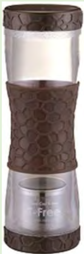
T-Free Amazon で 2,137円