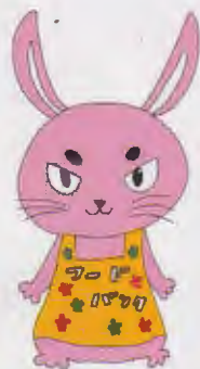
フードバンクの ラビちゃん