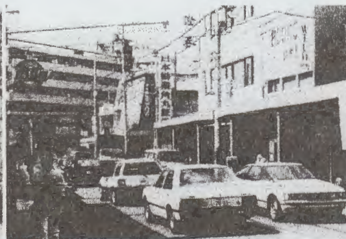
現 ファルマン交差点付近