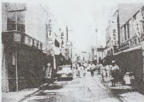
現 所沢プロペ商店街

今回の展示に設けます特設コーナーでは、20年ほど前に撮影した、動画の上映も予定しておりますので、どうぞ皆さま楽しみにお越しください♪