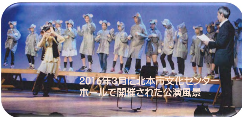
2016年3月に北本市文化センター ホールで開催された公演風景