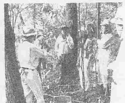
(調査前のミーティング風景)