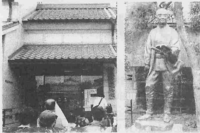
伊能忠敬記念館と旧宅の庭にある銅像