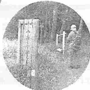
アレッ! 道間違えたかな!