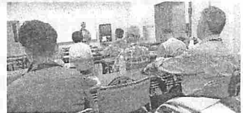
成績発表と表彰式