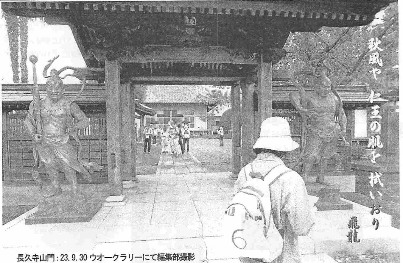
長久寺山門