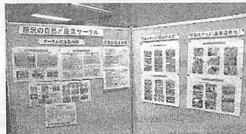
サークル活動状況展示(23.9.25~10.2)