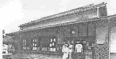
右：[コロット]の外観