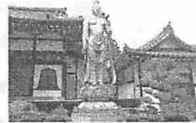
チェック・ポイントNo.8 「仏眼寺」