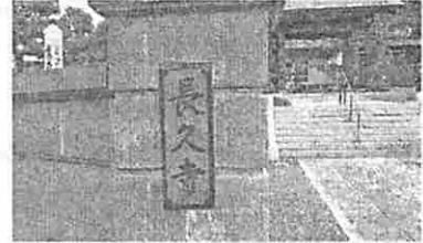
観察ゾーンA 「長久寺」