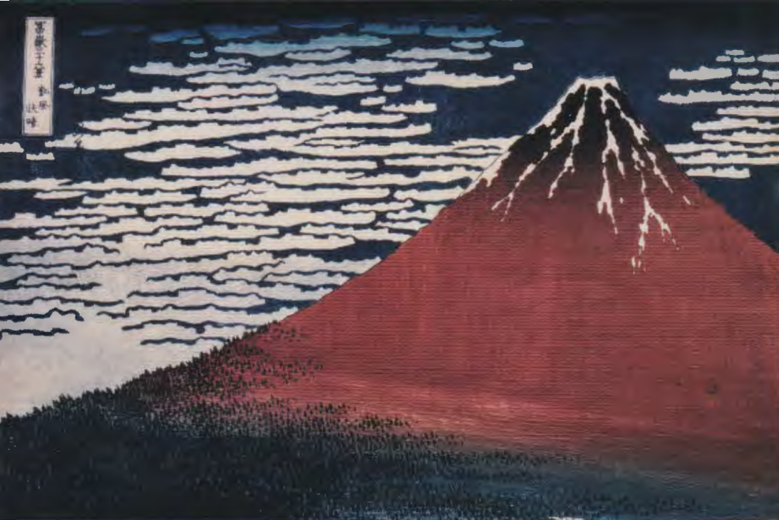
富嶽三十六景 凱風快晴