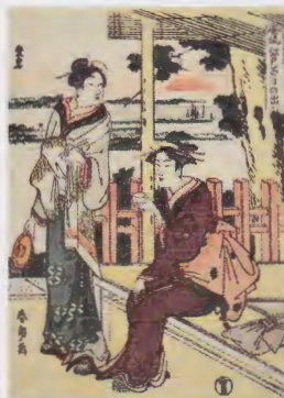
風流 江戸百日の出