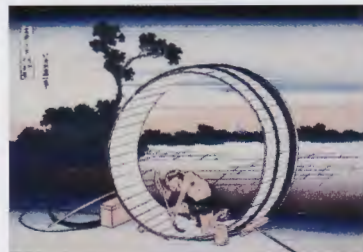
富嶽三十六景 尾州不二見原