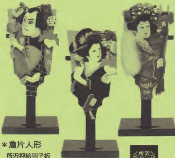
*倉片人形 所沢押絵羽子板 W10cm x D8cm x H24cm

このほかにも新しい年を迎えるべく干支の「寅」や手作り品・アクセサリ類も並べます。是非、おでかけください