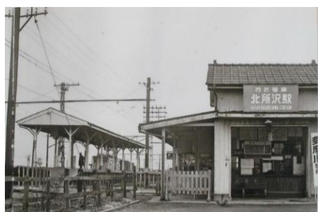
旧北所沢駅（現新所沢駅）