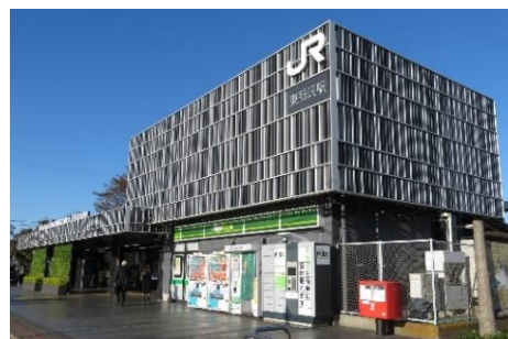
JR 武蔵野線東所沢駅