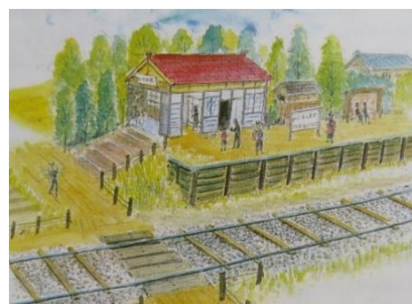
旧武蔵野鉄道東所沢駅